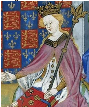
Margaretha di Napoli

Zijn vrouw, dochter van 'de koning van Napels'. Ze bemoeit zich vanaf het begin van haar komst met de regering. Is (lichamelijk dan) geliefd bij Suffolk, Buckingham en Somerset.