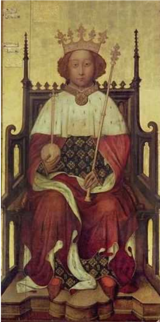
Richard II leefde van 1367 tot 1400 Richard II was koning van Engeland van 1377 tot 1399